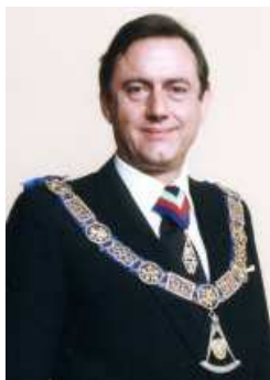
Pro First Grand Principal at the Supreme Grand Chapter of England

El Pro First Principal del Supremo Gran Capítulo de Inglaterra el mismo Pro Gran Maestro Marqués de Northampton, con lo cual se mantiene la misma estructura de mando que la Gran Logia Unida de Inglaterra.