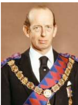
ME First Grand Principal at the Supreme Grand Chapter of England

El Supremo Gran Capítulo Real Arco de Inglaterra tiene aproximadamente 107.167 miembros agrupados en 3,484 Capítulos. Los Capítulos de Londres, ubicados dentro de un radio de 10 millas del Freemasons Hall, son administrados por el Gran Capítulo Metropolitano de Londres. Los Capítulos ubicados en Londres, fuera de este radio, y los de fuera de Inglaterra están agrupados en 47 Provincias, cada una encabezada por una Gran Superintendencia Provincial. El actual Primer Principal del Supremo Gran Capítulo del Real Arco es el mismo Gran Maestro de la Gran Logia Unida de Inglaterra, el Duke de Kent.